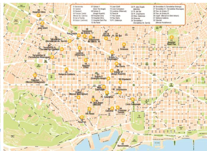
Mapes de la xarxa d'aparcaments B:SM i dels aparcaments de BAMSA i Saba on seran efectius els descomptes (veure documents adjunts)

Amb aquest acord, B:SM dona un valor afegit als seus abonats, ja que a la oferta de 40 aparcaments disponibles de la xarxa B:SM es sumen 32 més, els 15 de BAMSA i 17 dels que Saba gestiona a la ciutat . La finalitat de l'acord, a més, és poder oferir avantatges als usuaris alhora que s'agilitza el sistema de rotació a Barcelona, fent-lo més eficient, sostenible i econòmic pel ciutadà.